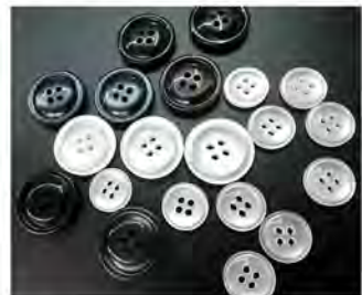
PEARL LITE buttons

Kanase's button business, the company's founding activity, is