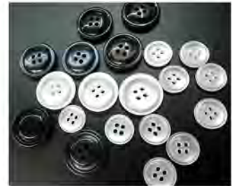
Botones PEARL LITE

La producción de botones, el negocio fundacional de Kanase, es actualmente la menos rentable de las dos principales áreas de especialización del fabricante. Sin embargo, el compromiso de retribuir a la sociedad alimenta la determinación de Kanase de mantener su larga tradición de producción de botones de alta calidad.