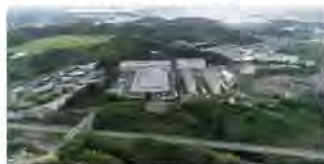
和歌山・カナセ本社

1919年、ボタン専門メーカーとして創業した株式会社カナセは、アクリル板のトップメーカーとしての地位を確立している。