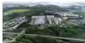
Kanase HQ, Wakayama

Since being founded as a specialist button maker in 1919, Kanase has also established itself as a go-to manufacturer of acrylic sheets.