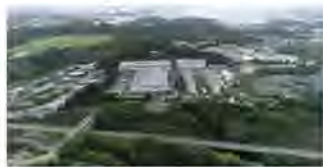
Sede de Kanase, Wakayama

Fundada en 1919 como fabricante de botones especiales, Kanase también se ha consolidado como uno de los principales fabricantes de láminas acrílicas.